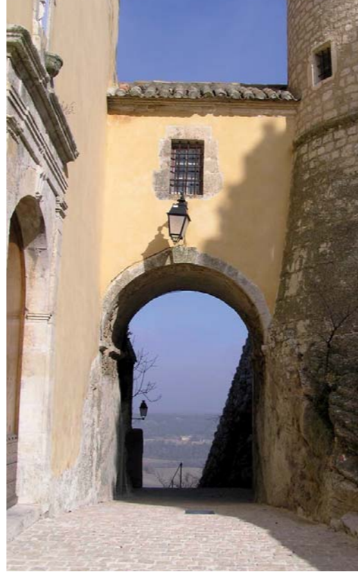
La galerie reliant la nouvelle église (XVII e siècle) au château.

Mais au XI e siècle la population se réfugie au pied du château fortifié pour se protéger des invasions répétées. Le village est alors très dynamique. À partir de 1348, il se vide de ses habitants suite à l'épidémie de peste noire. Au XVI e siècle il se repeuple et se développe grâce une forte activité agricole. Aux XVII e et XVIII e siècles, le village voit son château réaménagé pour plus de confort. Un grand parc de douze hectares y est créé avec une citerne de grande contenance ainsi que des jardins en terrasses. L'ancienne église a été abandonnée au profit de l'actuelle, construite par le châtelain François de Laurens à proximité du château. Le cimetière a été déplacé hors du village. La plupart des maisons du village datent de cette période. Quant à l'espace agricole, il est géré par les sept fermes du château pour le compte du châtelain. Aux XIX e et XX e siècles, Saint-Martin connaît tour à tour son apogée démographique en 1838 avec 472 habitants, l'exode rural à partir de 1841 puis un renouveau à la fin du XX e siècle,