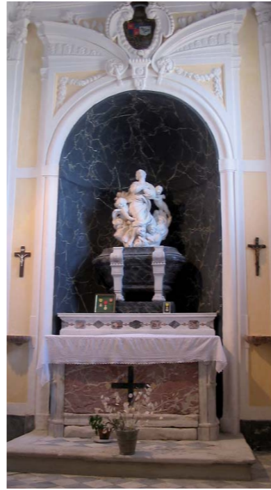
Le groupe de l'Assomption dans la chapelle de la Vierge.

Il ne faut pas confondre le lavoir et la bugade. En effet, la technique de la bugade existait avant l'invention du savon au XVII e siècle. Deux cuves sont nécessaires : l'eau est chauffée dans la première à l'aide d'un feu de bois, dans la seconde, plus grande, est mis le linge sale. On y place un « charrier », grand drap replié rempli de cendre de chêne, qui sert alors de filtre. On verse l'eau bouillante sur celui-ci. L'opération dure quatre heures après lesquelles le linge blanchi est rincé à la rivière ou au lavoir. Les deux techniques peuvent donc être complémentaires.