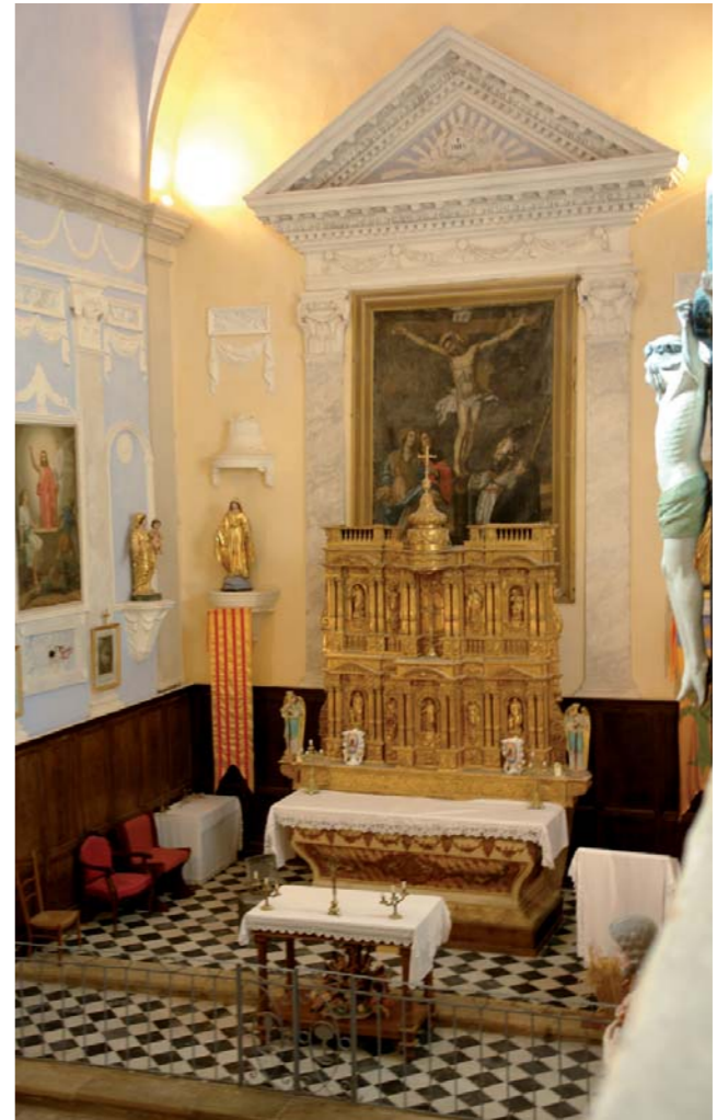
Le chœur de l'église et son retable en bois doré du XVII e siècle.