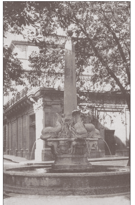
Hôtel de Boisgelin et fontaine des Quatre-Dauphins à Aix-en-Provence.