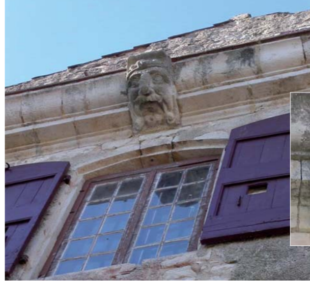
Mascarons du château de Saint-Martin-de-Pallières.

dû notamment à l'arrivée de nombreux étrangers. Sa silhouette se modifie dès 1820 avec la restauration du château, dégradé à la période révolutionnaire. Ce dernier est également agrandi entre 1862 et 1865 (tour et façades de la partie ouest, aile est du château). Quant au village, la tour de l'Horloge sera construite en 1830 et de nouvelles places apparaissent, comme la place Majouralo, construite à l'occasion de la formation des faubourgs.