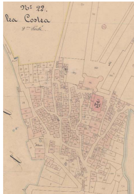
Extrait du cadastre napoléonien : le cœur du village et le château dans la première moitié du XIX e siècle.

Dominant les vallées du Grand Vallat et de la Bastidette, il est situé le long de l'ancienne voie de communication entre Draguignan et la vallée de la Durance. Son emplacement est donc stratégique. Le territoire de Saint-Martin est occupé par l'homme dès la Préhistoire. L'habitat est alors situé en hauteur. Au cours de l'Antiquité puis au Moyen Âge, d'importantes fermes sont construites dans la plaine.